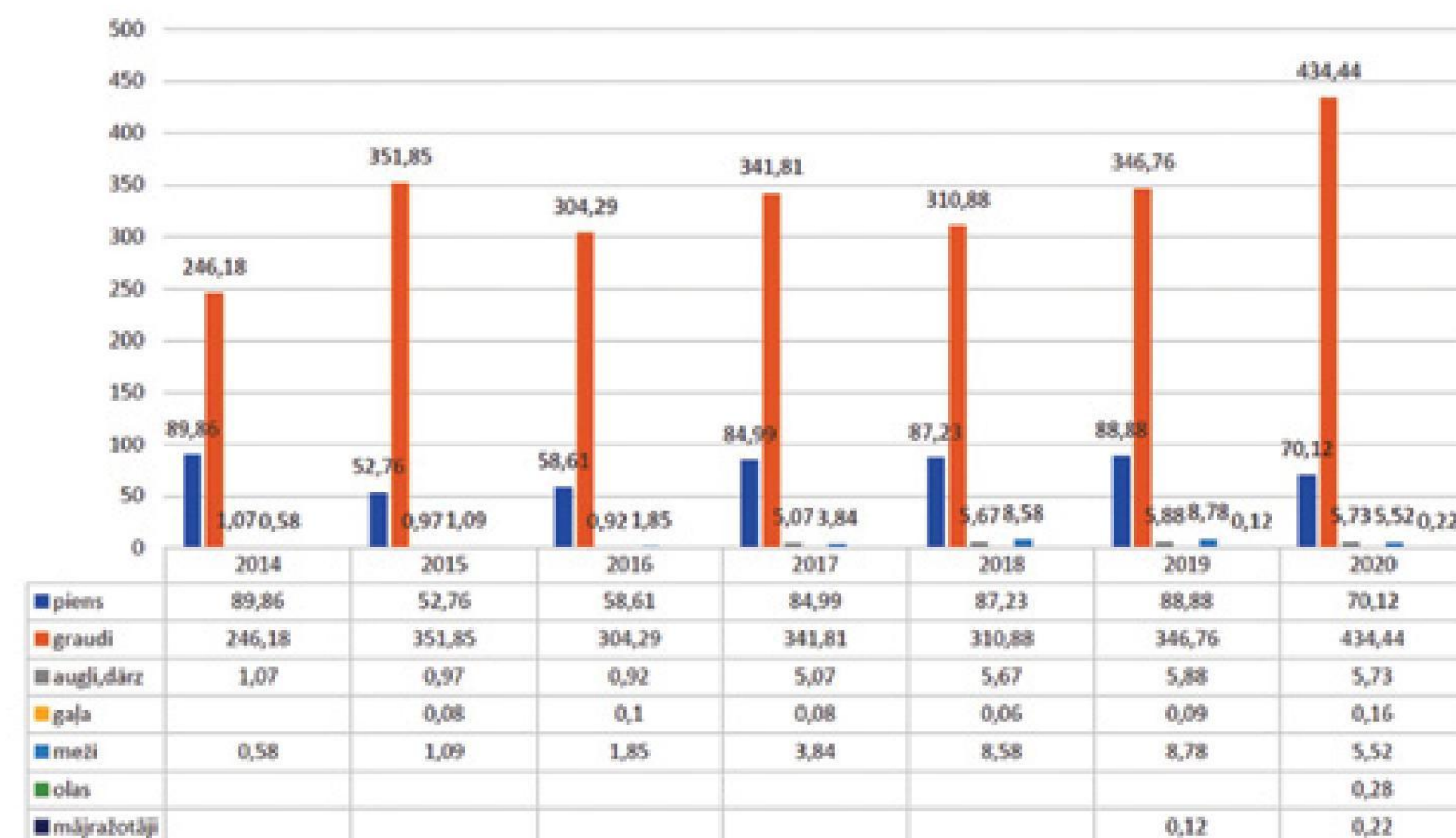
KS neto apgrozījums pa nozarēm 2014.–2020. gadā, milj. eiro

– Pandēmijas laiks ir bijis ražens kooperācijā – pērn tirgū sevi nopietni pieteica 2018. gadā dibinātais putnkopju koope-